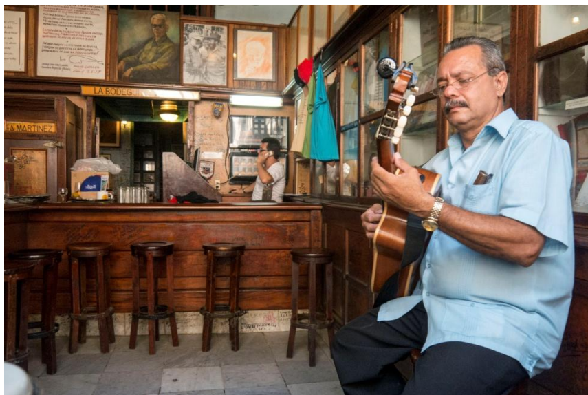
La Bodeguita Del Medio, Havana.