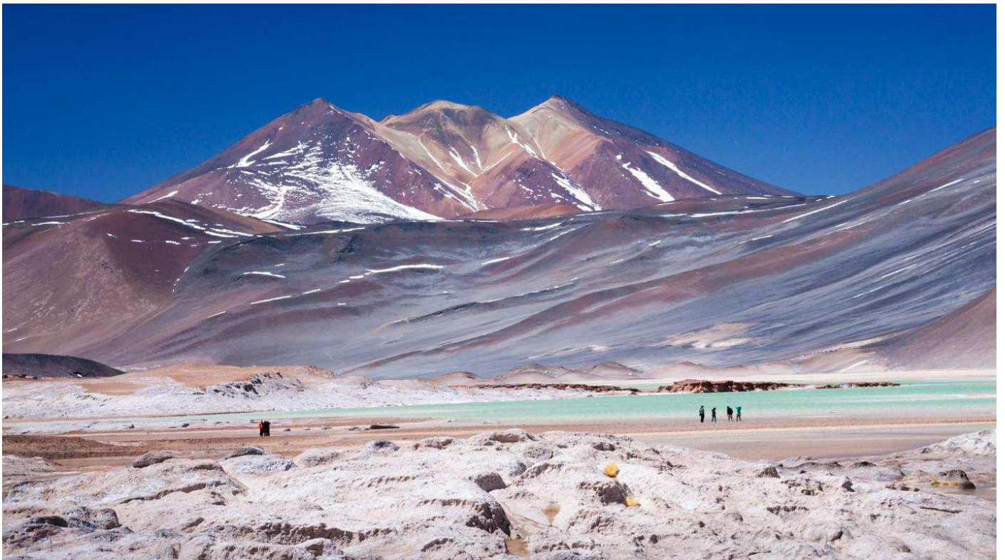
I vulcani innevati, i fenicotteri in volo sopra i laghi dell'altopiano e i geyser più potenti del sudamerica