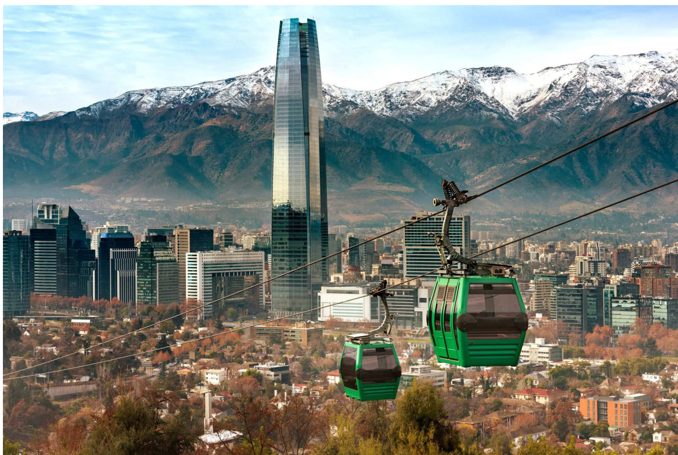
La funivia con il Costanera alle spalle