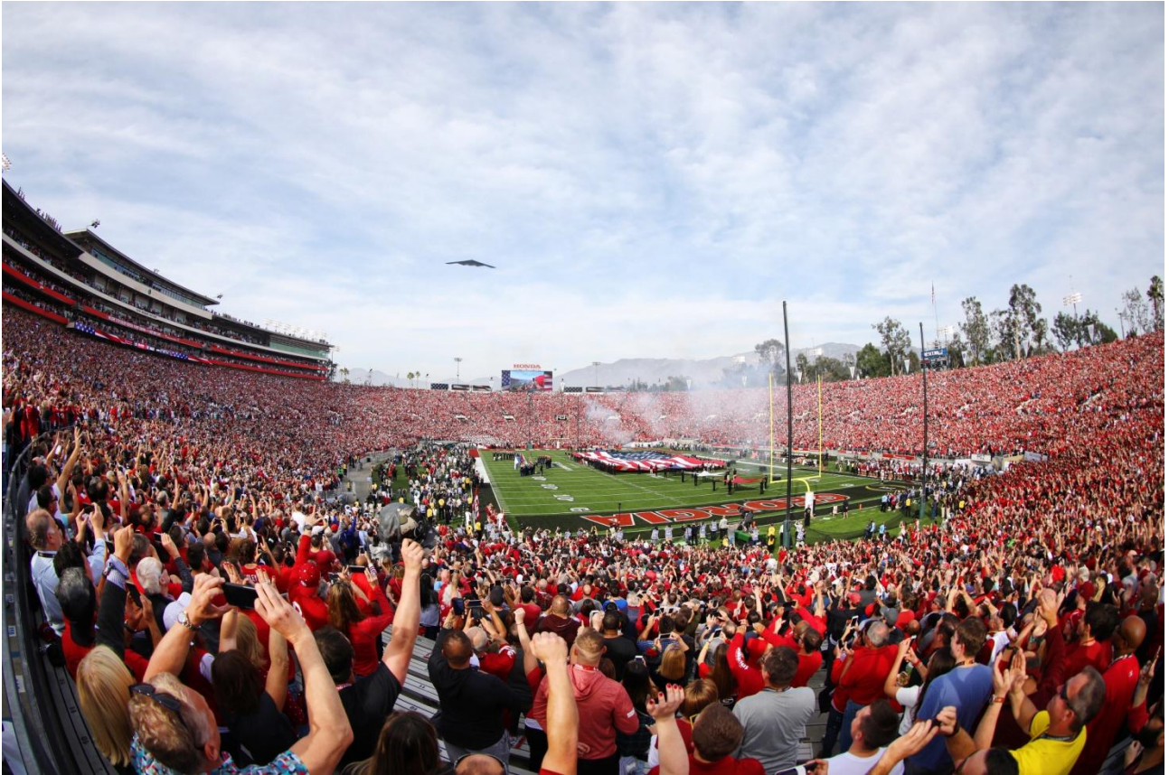
Rose Bowl experience, dove Baggio e compagni persero la finale di Usa 94 contro il Brasile